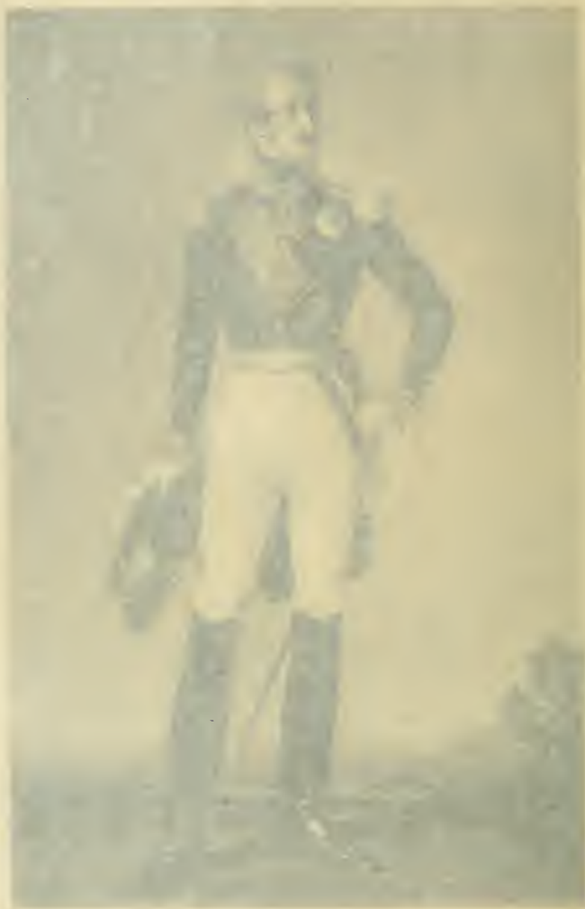
LE DUC DE NEMOURS EN UNIFORME DE LIEUTENANT-GÉNÉRAL 1843